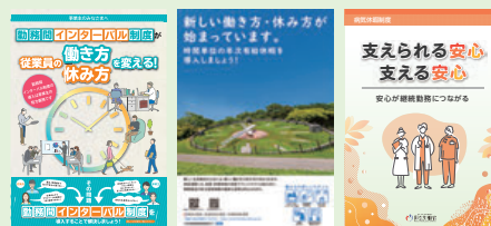
各制度に関するリーフレット(例)

「勤務間インターバル制度」「時間単位の年次有給休暇」「特別な休暇制度」などについて、企業の取組事例の紹介や、リーフレットなどの資料を掲載しています。自社における制度検討の参考にご活用ください。