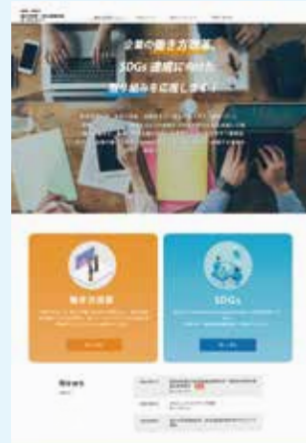
働き方改革・SDGs推進企業ポータルサイト http://company-portal.city.niihama.ehime.jp